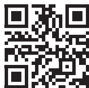
Site web Journée Suisse du Foie