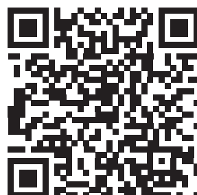
Journée Suisse du Foie 2024 (français)